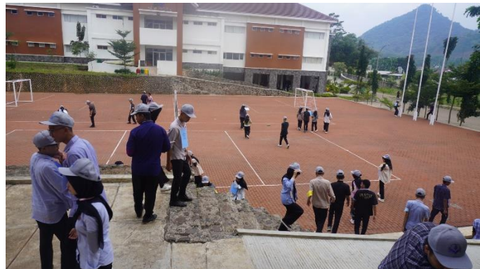
Gambar 9. Kaliber 25 Mencari kertas berupa clue untuk memecahkan masalah