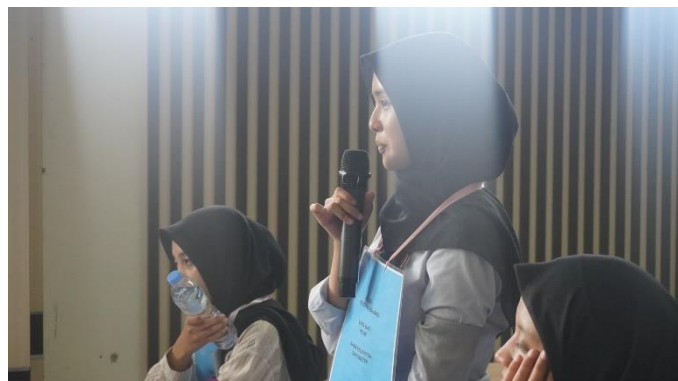
Gambar 7. Sesi Tanya Jawab mengenai materi Kedisiplinan