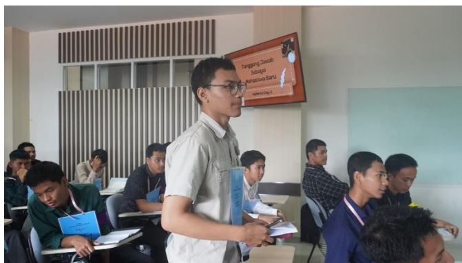
Gambar 4. Sesi Tanya Jawab mengenai materi Tanggung Jawab Bagi Mahasiswa