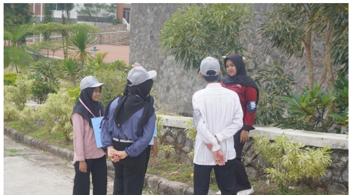
Gambar 10. HMMI 24 memberikan pertanyaan bersyarat berupa permainan atau pertanyaan bebas kepada kaliber 25 untuk mendapatkan 2 barang yang akan di serahkan ke panitia kedua yang akan diberikan pertanyaan SEPUTAR HMMI terhadap kaliber 25